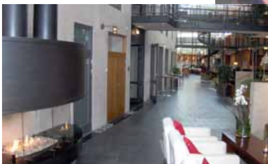
Lite av den speciella inredningen på Hotel Skansen

Ett värmande bad i poolen efter ett dopp i ett betydligt kyligare hav.